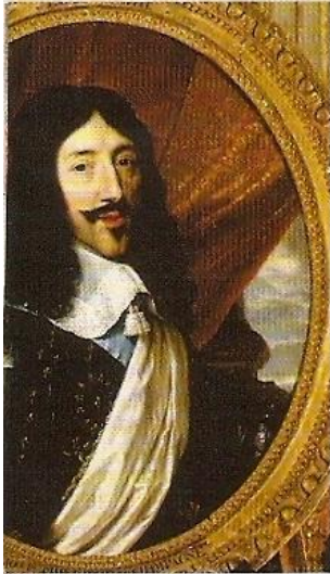
Philippe (Monsieur), duc d'Orléans (1640-1701)