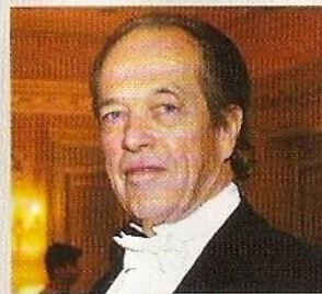
Henri , comte de Paris (1933)